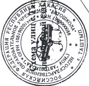
Схема улиц для движения автомобилей

Утверждаю: Начальник ГИБДД Таштыпского района майор милиции А. Сипкин